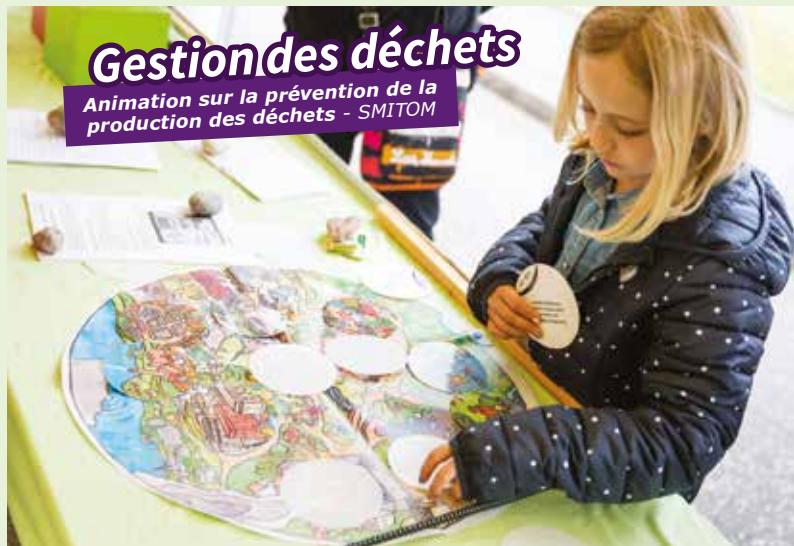
Gestion des déchets Animation sur la prévention de la production des déchets - SMITOM