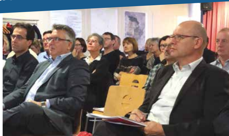
Séminaire pour le projet de territoire.

L'heure est aujourd'hui à la priorisation des actions et le scénario final se dégage pour un projet de territoire qui devrait être formalisé d'ici peu.