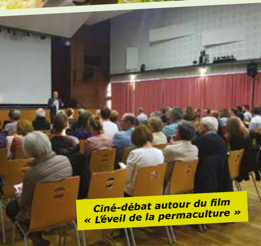
Ciné-débat autour du film « L'éveil de la permaculture »