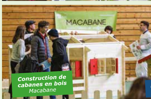
Construction de cabanes en bois Macabane