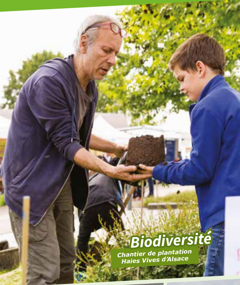
Biodiversité Chantier de plantation Haies Vives d'Alsace

Le 19 mai dernier, la Communauté de communes organisait la cinquième édition de la Basse-Zorn à l'An Vert à l'Espace W de Weyersheim. Cette manifestation annuelle éco-citoyenne a pour objectif d'informer et de sensibiliser les habitants sur des actions mises en place par la collectivité dans le domaine du développement durable.