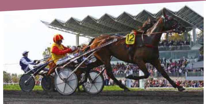
Les dates des réunions des prochaines courses sont disponibles dans le calendrier des fêtes et manifestations du 2e semestre 2019.

La saison 2019 est déjà bien entamée et les courses se sont disputées dans de très bonnes conditions. A noter que l'Etat verse aux Etablissements Public de Coopération Intercommunale, qui comptent parmi leurs communes-membres une commune accueillant un hippodrome, une redevance au titre des enjeux de l'année N-1. La Communauté de communes de la Basse-Zorn a ainsi perçu un versement d'un montant de 92.000 € en 2018 . L'hippodrome de Hoerd emploie 5 personnes à temps plein , plus un grand nombre de vaca-