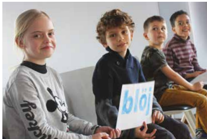
Semaine d'immersion en alsacien, février 2019

Le Conseil Départemental du Bas-Rhin, attentif au projet global d'aménagement de la zone de l'EPSAN à Hoerdt, porté par la Communauté de communes, a proposé la cession à la Communauté de communes d'un ensemble foncier homogène de parcelles agricoles représentant 17 hectares, idéalement situé entre le site de l'EPSAN et l'autoroute A 35. Cette acquisition revêt un grand intérêt, du fait qu'elle permet de constituer une emprise cohérente dans le prolongement du site, démultipliant ainsi son caractère stratégique et appuyant la faisabilité de projets de développement économique à moyen terme sur notre territoire.