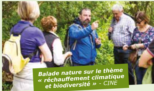
Balade nature sur le thème « réchauffement climatique et biodiversité » - CINE