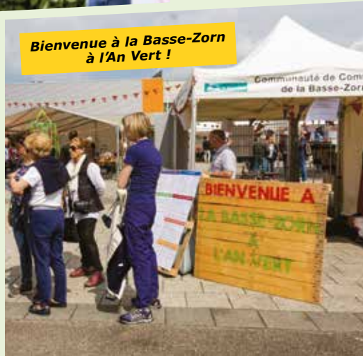
Bienvenue à la Basse-Zorn à l'An Vert !