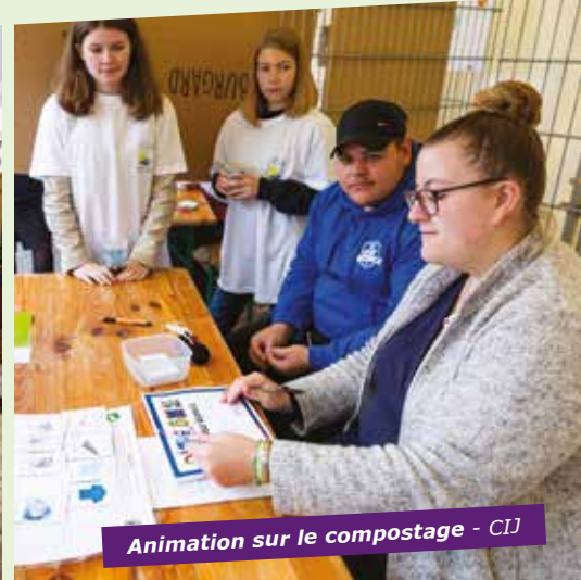
Animation sur le compostage - CIJ