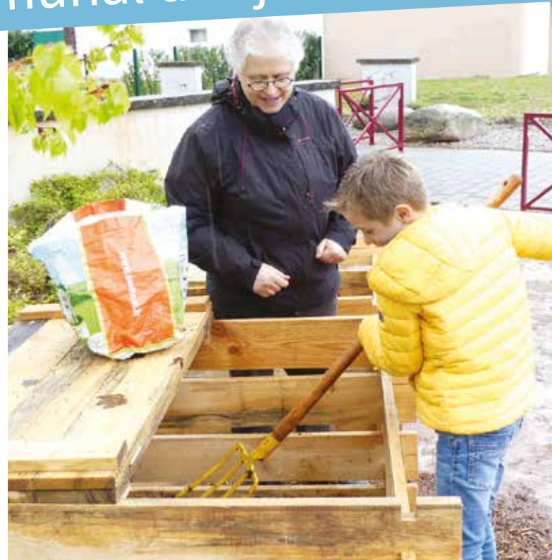
Composteurs collectifs dans les écoles et périscolaires de la Basse-Zorn. La Communauté de communes vous propose également des composteurs individuels de 360L à 20€ ou de 1 m 3 à 25€.

Le Conseil intercommunal des jeunes pour la période 2016-2018 a travaillé sur de nombreux projets : organisation d'un tournoi multisports, développement du compostage dans les écoles ou périscolaires du territoire ainsi que la réalisation de courts métrages expliquant comment prévenir le harcèlement en ligne et à l'école , qui leur a valu de présenter leur réalisation au Conseil de l'Europe à l'occasion du Mois de l'Autre , organisé par la Région Grand Est.