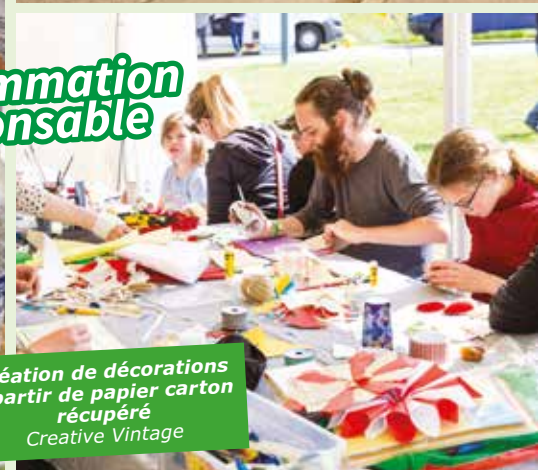
Création de décorations à partir de papier carton récupéré Creative Vintage