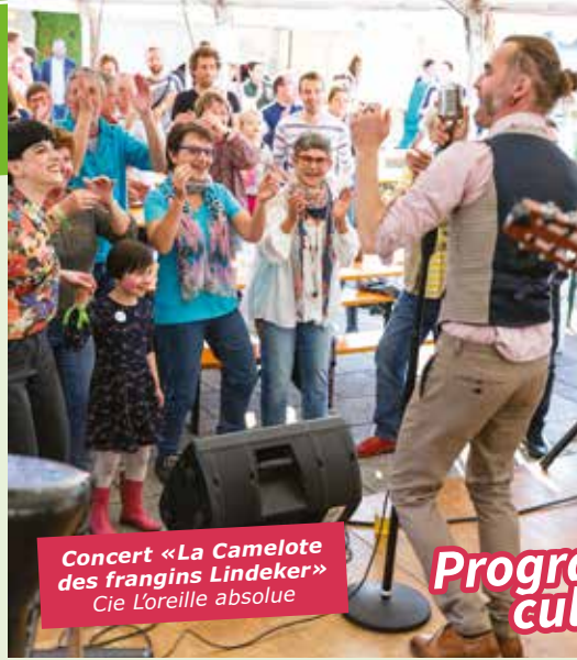
Concert «La Camelote des frangins Lindeker» Cie L'oreille absolue