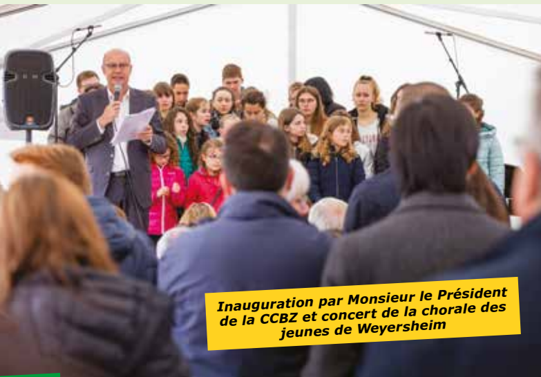
Inauguration par Monsieur le Président de la CCBZ et concert de la chorale des jeunes de Weyersheim