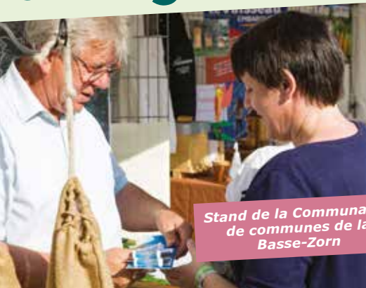
Stand de la Communauté de communes de la Basse-Zorn