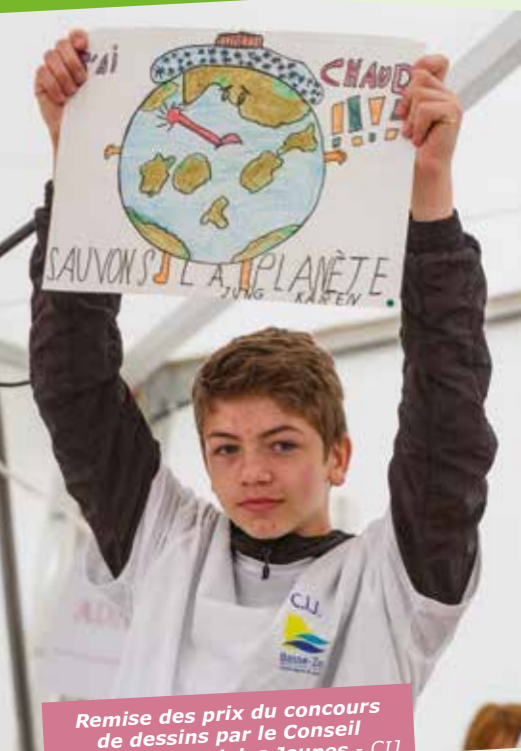
Remise des prix du concours de dessins par le Conseil Intercommunal des Jeunes - CIJ