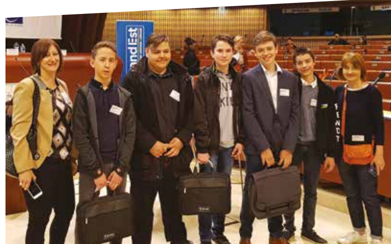
Le Conseil Intercommunal des Jeunes au Conseil de l'Europe pour le Mois de l'Autre .