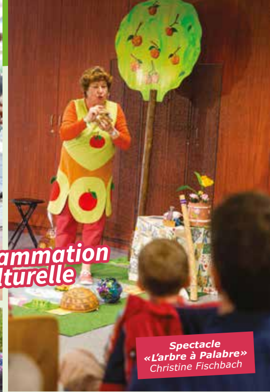
Spectacle «L'arbre à Palabre» Christine Fischbach