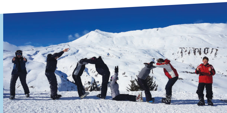
Séjour ski AJBZ - février 2020

Le dernier séjour dans le chalet "vacances et montagne" aux Contamines Montjoie du 15 au 22 février 2020 s'est parfaitement déroulé. Quelques réticences se sont fait connaître juste avant le départ suite à un fait médiatisé de Coronavirus dans la station, mais la gestion de la commune sur ce cas isolé a permis de partir en toute quiétude et sécurité.