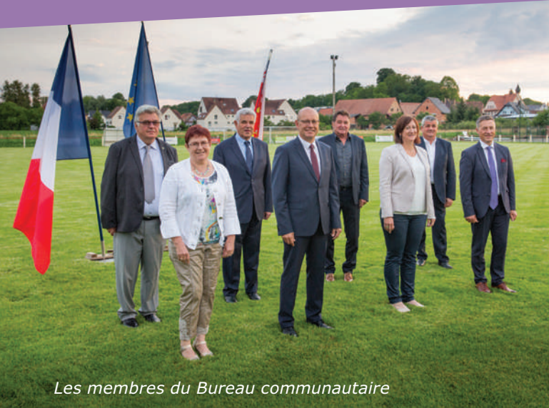
Les membres du Bureau communautaire