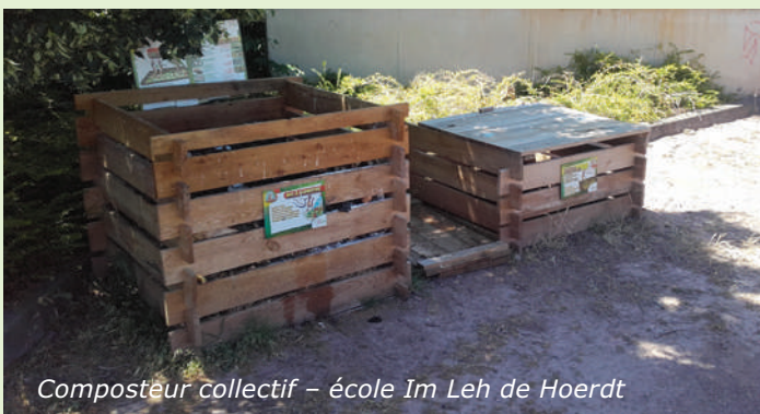
Composteur collectif – école Im Leh de Hoerd

Si vous souhaitez composter vos déchets de jardin (tontes de gazon, feuilles mortes..) ou valoriser vos déchets de cuisine à la maison, la Communauté de communes vous invite à installer un composteur individuel dans votre jardin. Pour vous aider dans cette démarche de réduction de vos déchets, vous pouvez acquérir des composteurs en bois à assembler (360 litres à 20 € ou 1 m 3 à 25 €), ainsi que des bioseaux et des sacs krafts compostables à la Maison des services (premiers bio-seau et lot de sacs krafts gratuits pour l'achat d'un composteur).