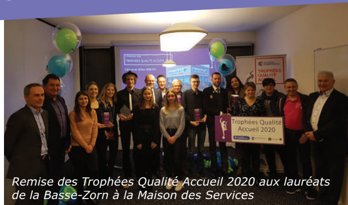
Remise des Trophées Qualité Accueil 2020 aux lauréats de la Basse-Zorn à la Maison des Services