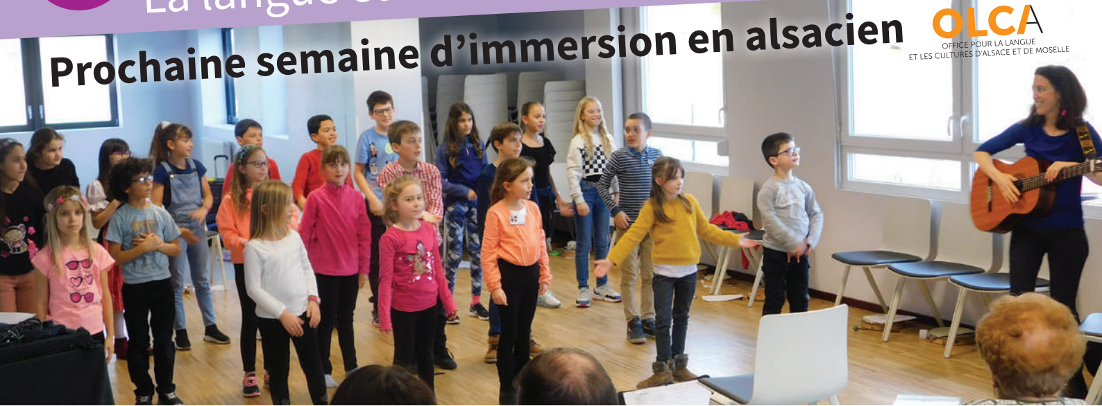
Semaine d'immersion en alsacien - février 2020

Les semaines d'immersion en alsacien connaissent un franc succès et la Communauté de communes a à cœur de continuer ces actions. La prochaine session se tiendra en octobre 2020, sous condition que la situation sanitaire le permette. Les informations et les modalités seront communiquées dès qu'elles seront établies.