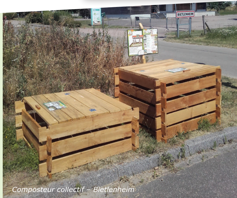
Composteur collectif – Bietlenheim

▶ Ces composteurs sont partagés ! Pour que tous ceux qui le souhaitent puissent y accéder, je ne le remplis pas avec les déchets de jardins volumineux (qui peuvent être apportés en déchèterie), comme les tontes de gazon ou les tailles de haies, et je laisse le site propre quand je repars.